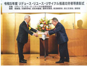
令和5年度 リデュース・リユース・リサイクル推進功労者等表彰式 主催：環境省、国土交通省、経済産業省、農林水産省、国土文部省、国研院 協賛：新潟県、新潟県庁、新潟県商工会議所連合会、新潟県商工組合連合会、新潟県商工団体協会、新潟県商工団体連合会